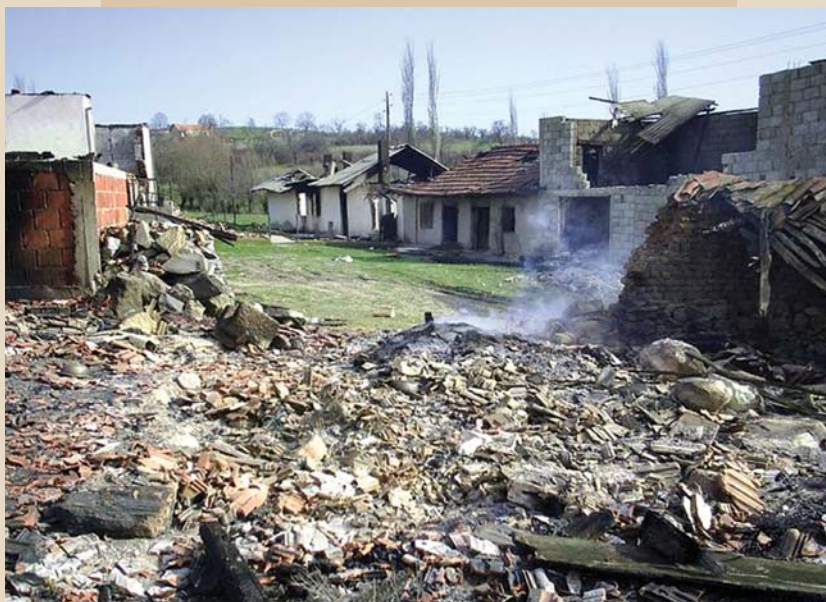
Згариште српских кућа