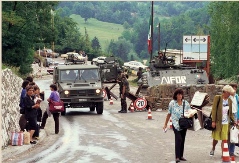
Ограничена слобода кретања: контролни пункт Кфора

У случају Косова и Метохије овај недостатак легалног основа за подршку албанском сецесионизму надокнађиван је дискутабилним моралним разлозима и аргументима. Класична оружана агресија названа је у ту сврху хуманитарном интервенцијом. И као што бива, нико ову супституцију права моралом није боље изумио до један познати хуманистички филозоф. Прихватавши здраво за готово извештаје са терена, који су заиста били стравични, Јирген Хабермас је својевремено (априла 1999. у недељнику Die Zeit) свој прилог разјашњењу природе интервенције НАТОа насловио на необично експресиван начин: „Бестијалност и хуманост – рат на