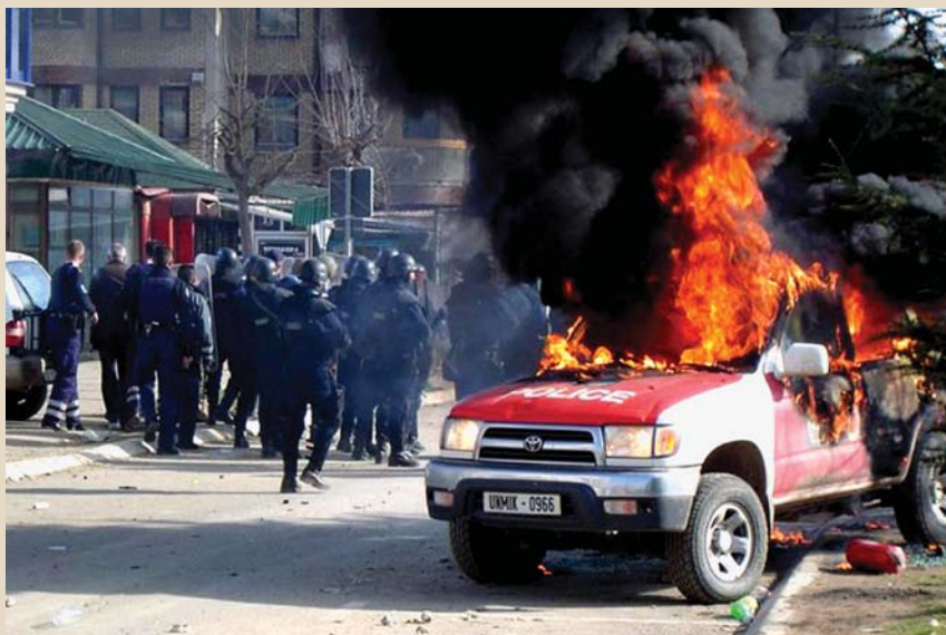
Нескривена мржња албанских екстремиста: напад на припаднике Унмика у јужном делу Косовске Митровице

Највећи талас насиља, убистава и отмица догодио се након доласка припадника међународних војних снага у летњим месецима 1999. године. Према подацима Владе СРЈ за период