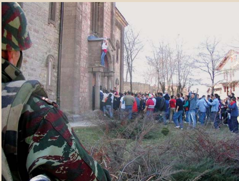
Терор пред очима чувара мира: напад на српску светињу

Све ово није случај на Косову и Метохији и све то није тешко описати, измерити и оценити. Али, како смо видели из техничког извештаја специјалног представника о испуњености стандарда, све то није тешко ни фалсификовати. Сама могућност да се тако нешто учини, а немоли реалност већ учињеног, изазива оправдане сумње у пожељну улогу међународ-