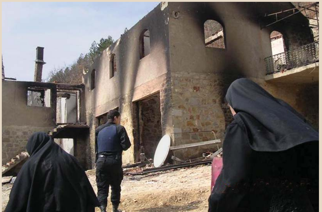
Тужни повратак: монахиње спаљеног манастира Девич

Пилот пројекти за децентрализацију општина на Косову и Метохији само су делимично успели. На питање да ли ће се они и применити, без обзира на противљење косметских Срба